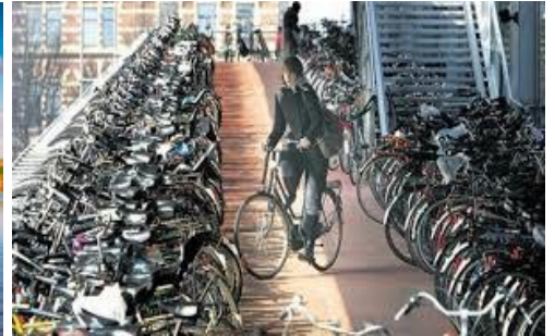
doprava bicyklami v Holandsku

Holandsko má približne 17,5 miliónov obyvateľov a má vysokú hustotu zaľudnenia. Najväčšími mestami sú Amsterdam (hlavné mesto Holandska), Rotterdam (najväčší prístav v Európe), Haag (sídlo európskeho súdneho dvora) a Eindhoven .