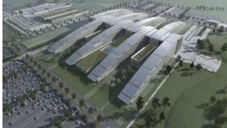
budova NATO v Bruseli