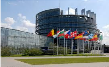
budova Európskeho parlamentu

Belgicko je malý Európsky prímorský štát (severozápad Belgicka obmýva Lamanšský prieliv ) Belgicko patrí medzi vyspelé hospodárske štáty Európy. Belgicko a jeho hlavné mesto Brusel bolo zvolené za hlavné sídlo Európskej únie a hlavné sídlo NATO (NATO – severoatlantická vojenská aliancia) v Európe.