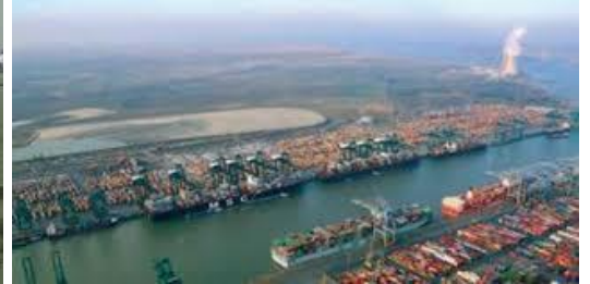
Antverpy – najväčší prístav

Belgicko susedí so 4 štátmi (Francúzsko, Luxembursko, Nemecko a Holandsko).